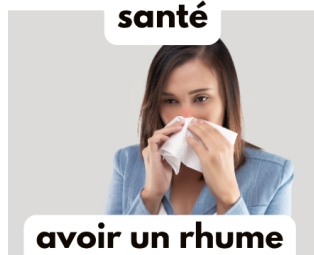
avoir un rhume