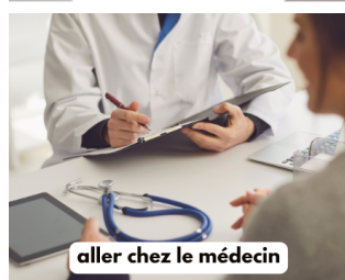
aller chez le médecin