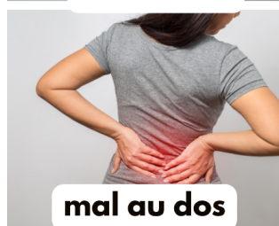
mal au dos