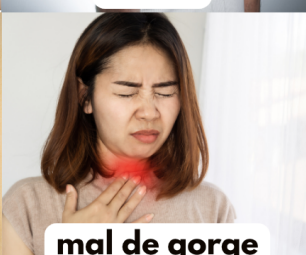
mal de gorge