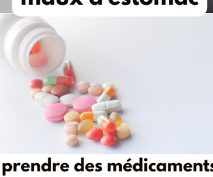
prendre des médicaments