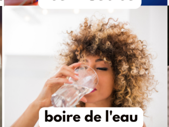
boire de l'eau