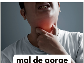
mal de gorge