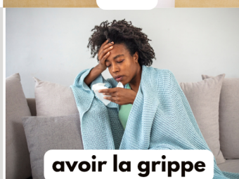
avoir la grippe